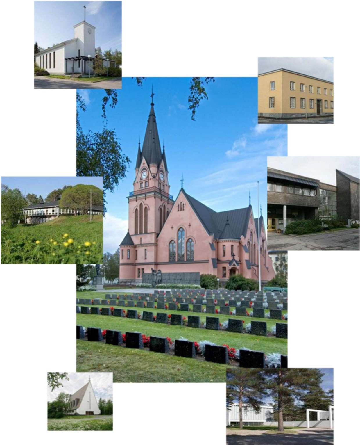
Kuvissa: Kemin Kirkko, Paattionlehdon kappeli, Peurasaaren kappeli, Seurakuntakeskus, Vanha Pappila, Saarenotan kurssi- ja leirikeskus, Veitsiluodon seurakuntakoti